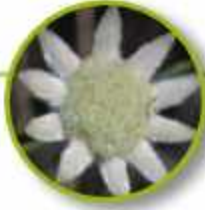
LITTLE FLANNEL FLOWER

Descorazonado fácilmente, resignación, apatía. Persistencia; voluntad para dar una dirección a las cosas, aplicación.