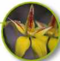
YELLOW COWSLIP ORCHID

Mujeres que se tensionan frente al sexo, son incapaces de disfrutar, miedo a la intimidad; miedo proveniente de un abuso sexual; machismo. Confianza, realización y goce de la sexualidad, gentileza, caballerosidad.