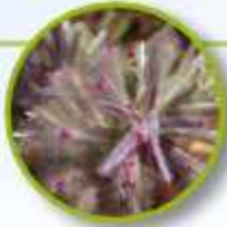
PINK MULLA MULLA

Profundas heridas psíquicas, persona reservada hirientes y críticos para mantener a la gente lejos y evitar ser heridos. Profunda sanación espiritual; seguridad, protección, confianza y receptividad.