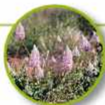
TALL MULLA MULLA

Egoísmo, negación, autosuficiencia, crítica, omnipotencia, incompreensión sobre el sentido de unidad. Tomar conciencia de que no hay separación entre el ser humano, los elementos que lo rodean y de su pertenencia al macrocosmos.