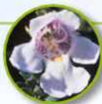
ALPINE MINT BUSH

Es para personas cansadas de la vida y que han perdido el gusto por vivirla, dado que les resulta algo monótona y repetitiva. Es benéfica para el cansancio mental y emocional, la falta de felicidad en hacer las cosas y exceso de responsabilidades. Revitalización, alegría, renovación.