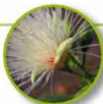
BILLY GOAT PLUM

Resistencia al cambio, rigidez, disgusto. Aceptación y apertura de mente. Abrirse a nuevos conceptos e ideas.