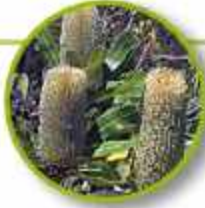
OLD MAN BANKSIA

Trauma asociado con el fuego, calor, quemaduras de sol. Miedo al fuego, llamas y objetos calientes. Reduce los aspectos negativos del fuego y de los rayos solares, rejuvenecimiento.