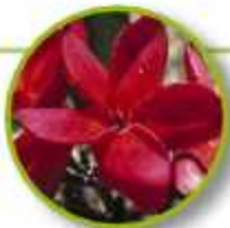
RED SUVA FRANGIPANI

Disociación, desconexión con la realidad. Pereza postergación y torpeza para actuar en lo concreto. Aterrizado, enfocado, viviendo el presente, integra sus capacidades creativas. Abre el chacra coronario; mejora la evaluación espiritual.