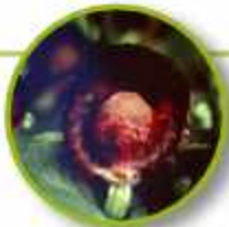
RED HELMET ORCHID

Sensación de estar atascado, con frecuencia le afecta el cinismo y las personas desagradables, demasiado dependientes de otros. Fuerza para dejar personas y situaciones desagradables; audacia; indiferencia a la crítica.