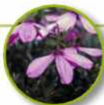
BLACK EYED SUSAN

Vergüenza, repulsión sexual, disgusto o versión al cuerpo o aspecto físico. Placer sexual, disfrutar, aceptación de propio cuerpo físico.