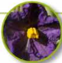
WILD POTATO BUSH

Dificultad para comprometerse con las relaciones laborales, personales, íntimas, etc. Compromiso en las relaciones y en las metas; dedicación al propósito de la vida.