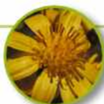
TALL YELLOW TOP

Persona fría, dubitativa, distante y solitaria. Evita la confrontación. Generalmente son orgullosos y arrogantes. Sensación de seguridad y relajo con otras personas, socialización, sencillez, apertura a los vínculos. Circulatorio y antihistamínico.