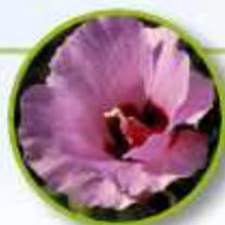
STURT DESERT ROSE

Culpa, baja autoestima como consecuencia de hechos en el pasado, fácilmente influenciado Poder escuchar la guía interna las propias convicciones y moral.