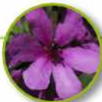
DOG ROSE OF THE WILD FORCES

Miedo, timidez, inseguridad. Miedo constante, aprehensión hacia las demás personas. Confianza, valor, creer en sí mismo: habilidad para recibir la vida plenamente.