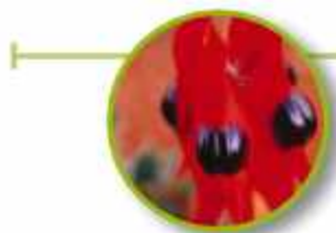
STURT DESERT PEA

Herpes, corte fino; sensación de ser víctima de una enfermedad. Devuelve el poder a través de la comprensión y la conciencia de la causa emocional de la enfermedad.