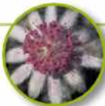
PINK FLANNEL FLOWER

Incapacidad para aceptar reconocimientos. Excesiva generosidad. Capacidad de recibir elogios; reconocimiento y amor; apertura a la abundancia.