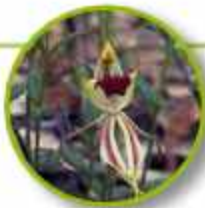
GREEN SPIDER ORCHID

Shock, trauma, daño al aura, pérdida de vitalidad y la energía (por otras personas o cosas por ejemplo: radiación) Elimina los efectos de viejos traumas o resientes. Protección psíquica, protección energética.