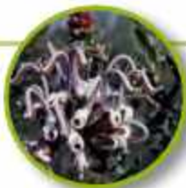
GREY SPIDER FLOWER

Pesadillas y fobias por experiencias de vidas pasadas; reacciones negativas intensas al ver sangre. Comunicación telepática, habilidad para guardar información hasta que sea el momento correcto, sintonía.