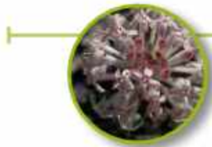
SLENDER RICE FLOWER

Sin objetivo; desalentado; falta de dirección en la vida. Motivación, dirección y propósito en la vida.